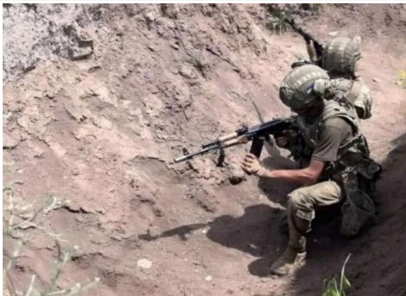
Збройні сили України досягли прогресу на Петрівському напрямку, звільнивши Надіївку, - ISW

Збройні Сили України на початку квітня 2025 року просунулися на Покровському напрямку, зокрема по вулиці Центральна (Леніна) у західній частині Новоелізаветівки, що на південний захід від Покровська, та звільнили Надіївку.