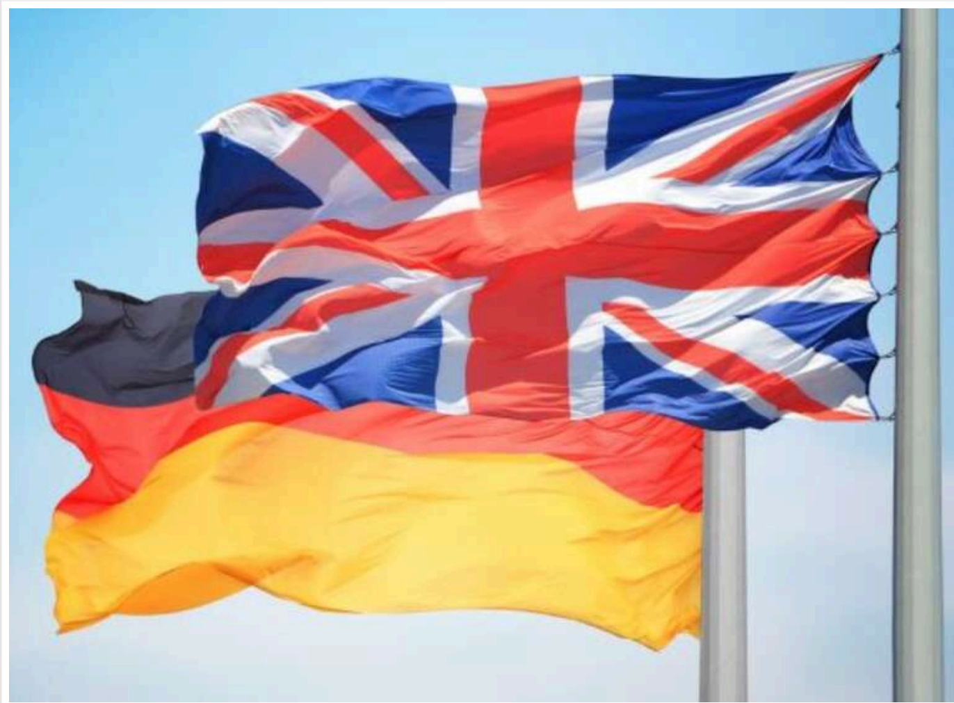
Наступний «Рамштайн» пройде під керівництвом Великої Британії та Німеччини й без США

Робота Контактної групи з питань оборони України (формат «Рамштайн») є важливим інструментом для реагування союзників і партнерів України на її нагальні безпекові потреби, і цей формат діятиме під керівництвом Великої Британії та Німеччини.