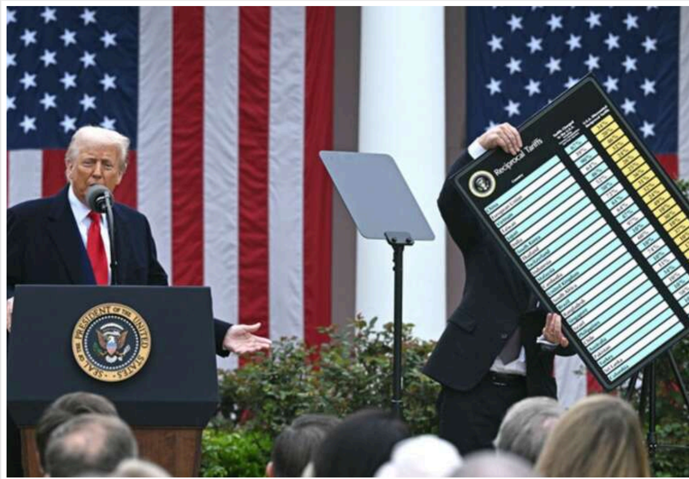
Мита Трампа призвели до падіння цін на айфони і збитків для мільярдерів

Запровадження високих мит президентом США Дональдом Трампом вдарило по найбільших світових компаніях, зокрема Apple, чия продукція тепер може подорожчати на 30-40%.