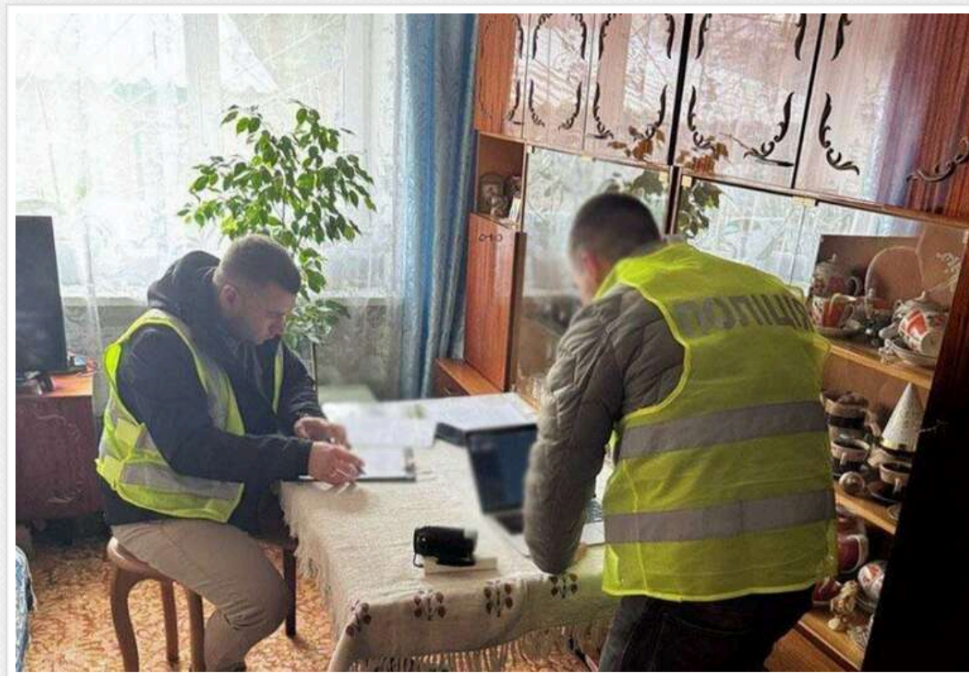
У Києві двоє колишніх банківських працівників привласнили понад 65 тисяч доларів померлого клієнта

У Києві правоохоронці викрили двох колишніх працівників банку, які скористалися своїм службовим становищем, щоб заволодіти грошима померлого клієнта.