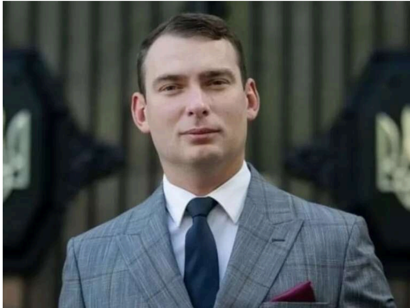
НАЗК не перевірило походження киявської квартири Ярослава Железняка за 2023 рік

Національне агентство з питань запобігання корупції (НАЗК) не здійснило перевірку декларації народного депутата Ярослава Железняка за 2023 рік, зокрема, походження його нової столичної квартири, вартістю понад 11 млн грн.