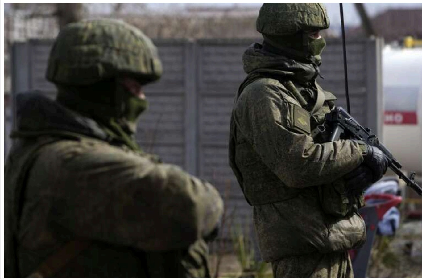
"Влада ЛНР" встановила в "республіці" "комендантську годину" для дітей

На території Луганської області, яка поза контролем України, місцева "влада" ухвалила новий "закон", який категорично забороняє дітям перебувати на вулиці після 22:00.