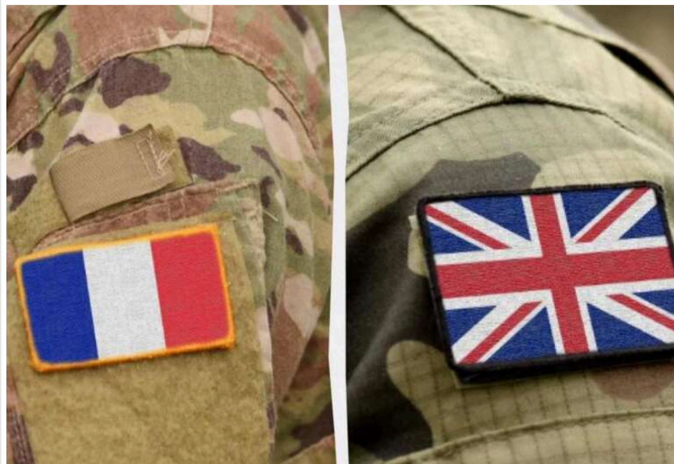
У Києві стартувала зустріч військових керівників Франції, Великої Британії та України щодо можливого розміщення миротворчих сил

У Києві розпочалася зустріч військових начальників Франції, Британії та України з приводу розміщення військового контингенту.