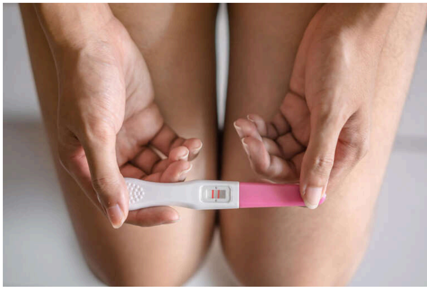
У Польщі жінку, яка планувала аборт через важкий діагноз у плода, примусово госпіталізували до психіатрії

Міністр охорони здоров'я Польщі розпорядився провести перевірку в Центральній клінічній лікарні Медичного університету в Лодзі після скандального випадку з пацієнткою, яка після заяви про намір перервати вагітність була поміщена в психіатричне відділення.