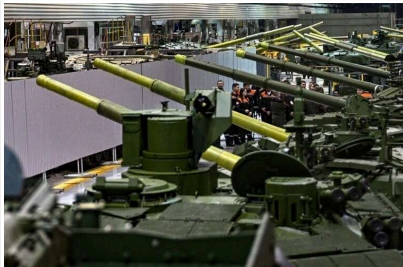
Росія обігнала НАТО з виробництва військової техніки, - RUSI

Згідно з новим звітом Королівського об'єднаного інституту оборонних досліджень (RUSI), Росія змогла перевищити НАТО за обсягами виробництва військової техніки в період з 2022 по 2024 рік, попри економічні труднощі.