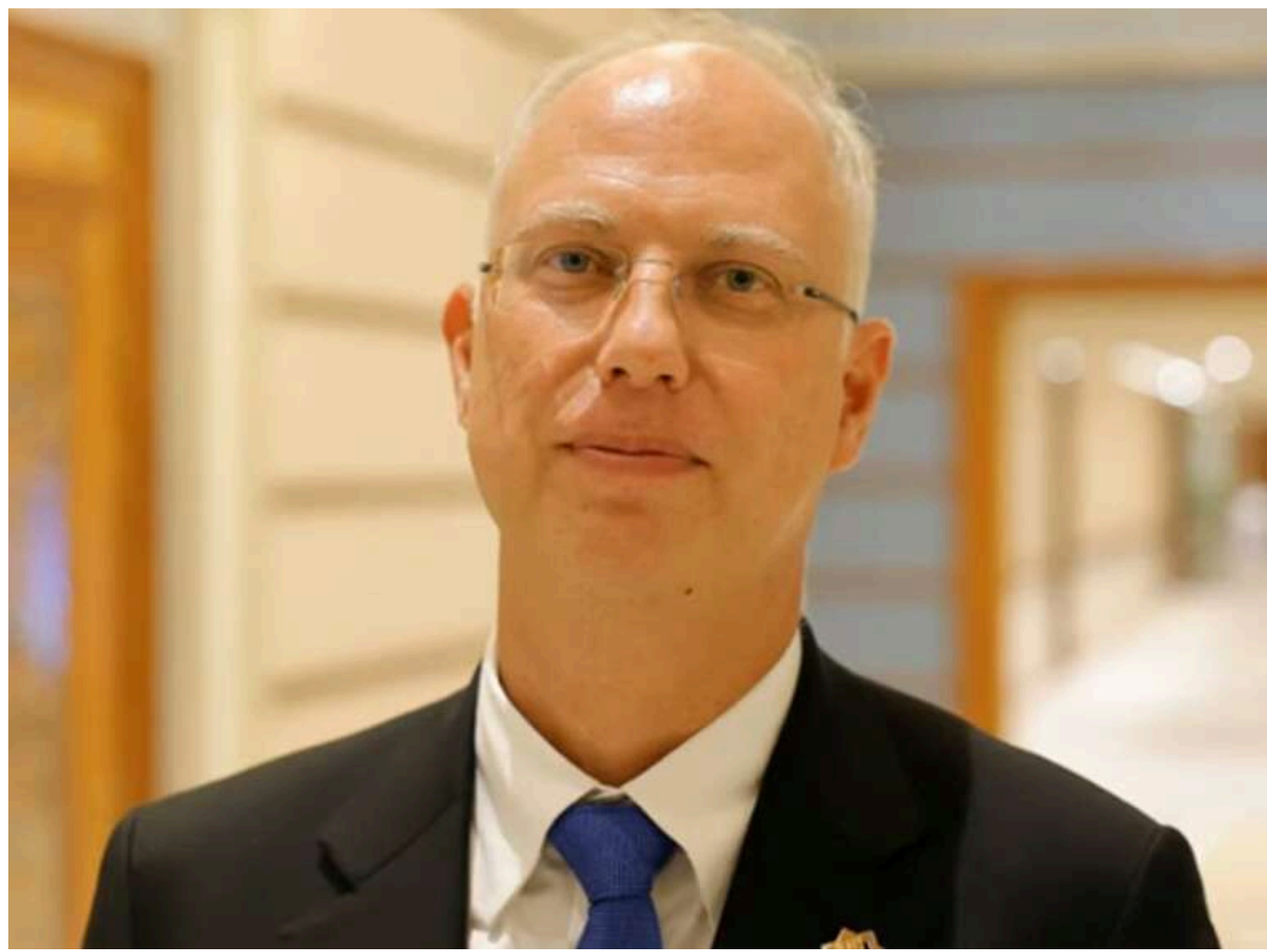
Представник Путіна Дмитрієв заявив про можливість гарантій безпеки для України, але проти вступу в НАТО

Представник російського диктатора Володимира Путіна Кирило Дмитрієв висловив неочікувану думку щодо гарантій безпеки для України.