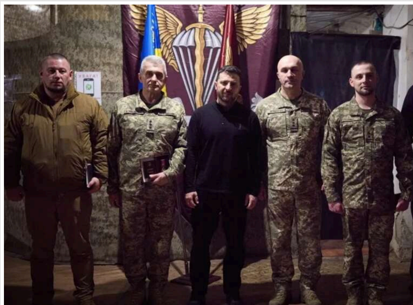
Зеленський вислухав звіт про операцію на Курщині та висловив подяку воїнам

Під час робочої поїздки на Сумщину президент України Володимир Зеленський відвідав один із командних пунктів, заслухав командувача щодо операції ЗСУ в Курській області. Верховний головнокомандувач не лише висловив подяку, а й особисто вшанував воїнів державними нагородами.