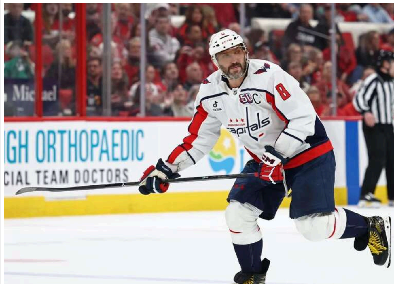
НХЛ відмовила пропагандистам ТАСС в акредитації на матчі з Овечкіним

Хокейна ліга США (НХЛ) відмовила російській агенції ТАСС в акредитації на матчі за участю Олександра Овечкіна.