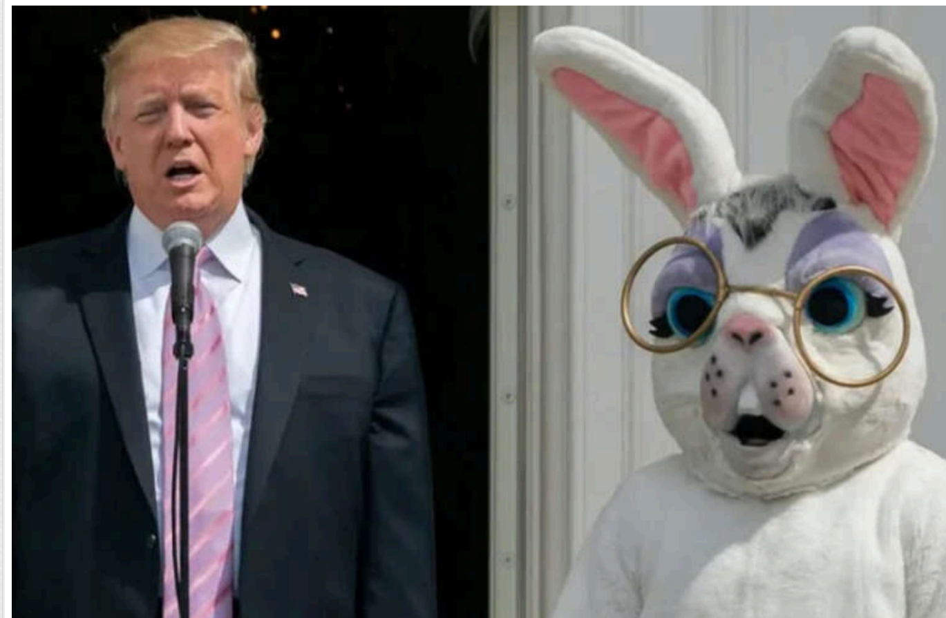
Білий дім використає 30 000 яєць для великодніх ігор, попри дефіцит і критику фермерів

Під час святкової гонитви за яйцями планують використати 30 тисяч справжніх яєць, попри дефіцит у США та значне підвищення цін.