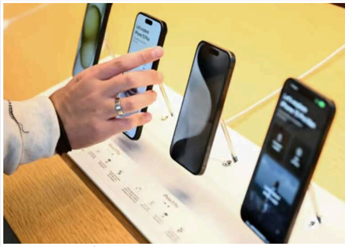
Вартість iPhone може зрости до $2300 через торгіву війну Трампа, — Reuters

Більшість компонентів iPhone виробляється в Китаї, проти якого США запровадили одні з найбільших тарифів, це означає, що вартість смартфона може зрости на 43%.