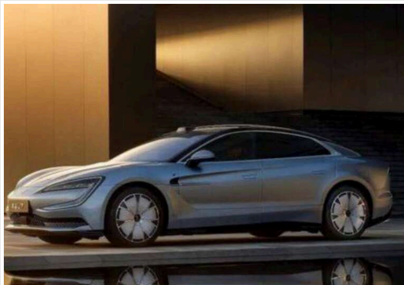
У Китаї представлено новий BYD Yangwang U7: потужний електроседан із запасом ходу 720 км

У Китаї представлено новий Yangwang U7. Потужний представницький седан від преміального підрозділу BYD надходить у продаж за ціною від 628 000 до 708 000 юанів ($86 500 - 98 000).