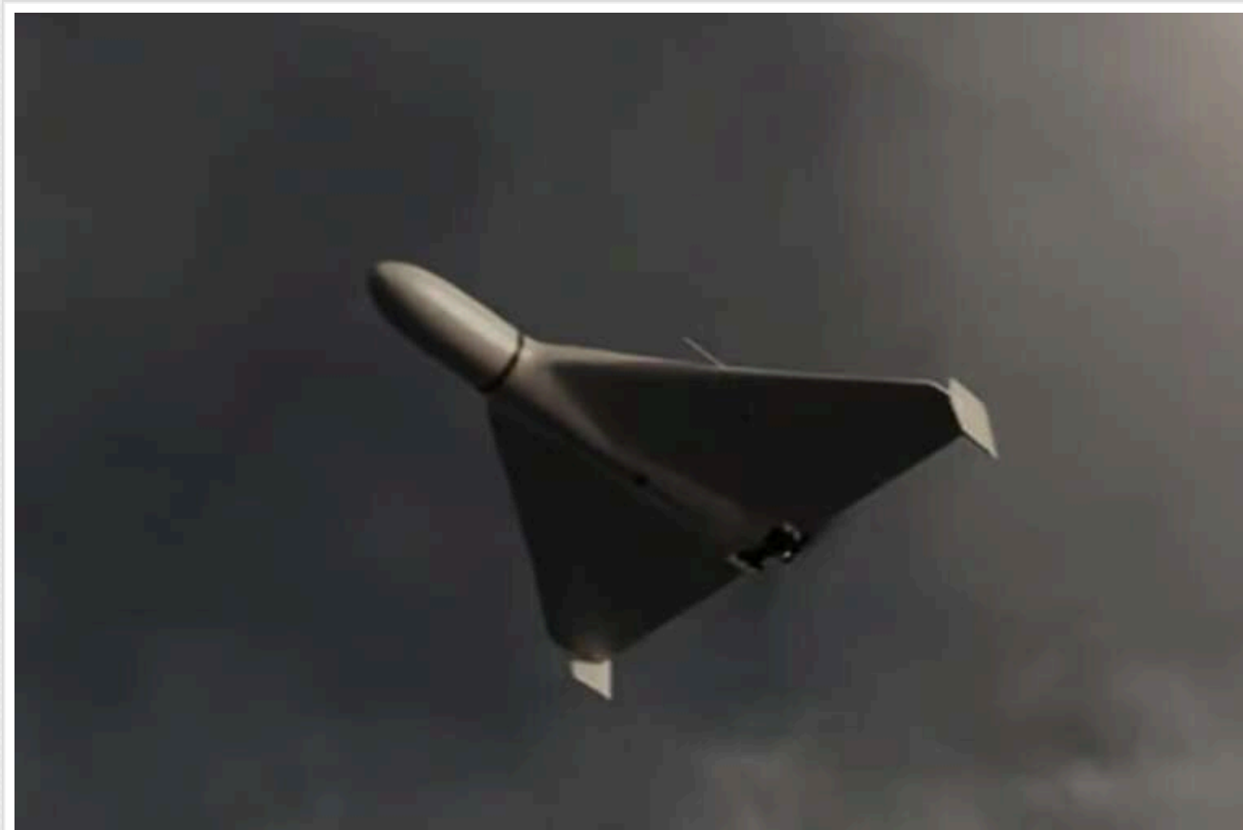
Тривога в Києві та кількох областях через загрозу "шахедів"

У Києві та ряді інших областей оголошено повітряну тривогу через загрозу атаки ворожими безпілотними літальними апаратами "Шахед".