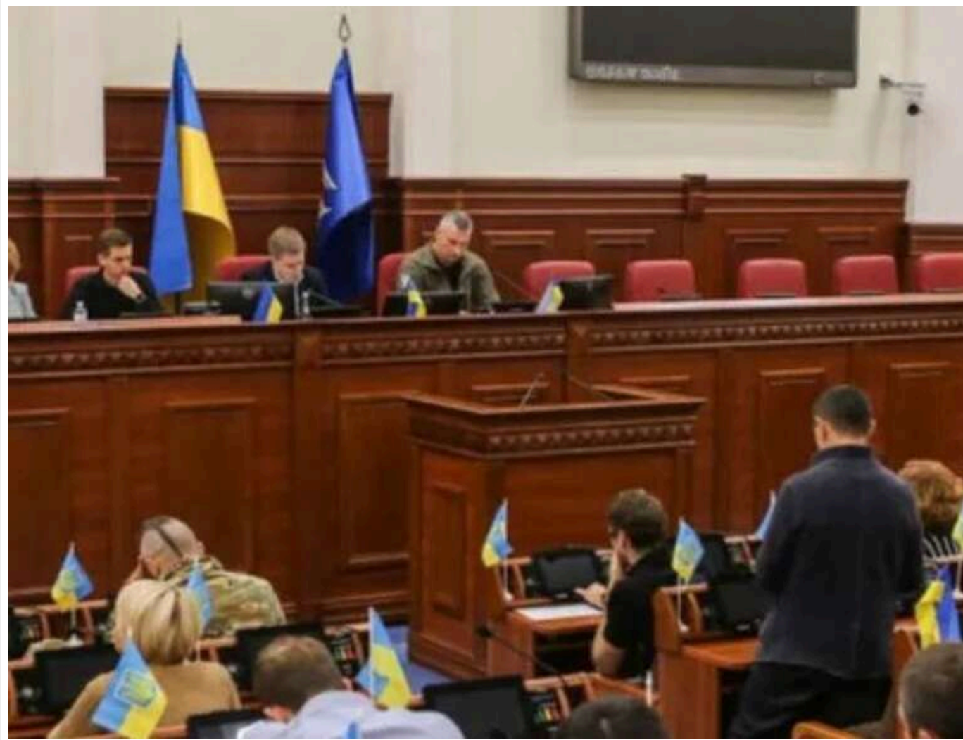
Скандал у Київграді: "земельна" комісія планує термінове засідання із суперечливим порядком денним