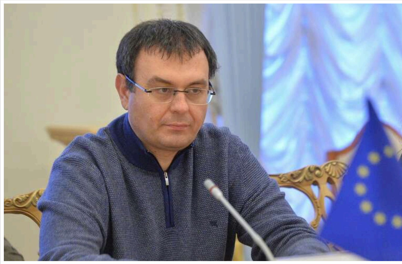
Мита Дональда Трампа не матимуть значного впливу на Україну - Гетманцев

Мита, введені Дональдом Трампом, не матимуть суттєвого впливу на економіку України, заявив голова Комітету Верховної Ради з питань фінансів, податкової та митної політики Данило Гетманцев. Він підкреслив, що частка товарного експорту України до США є досить незначною, складаючи лише 2% від загального обсягу експорту.