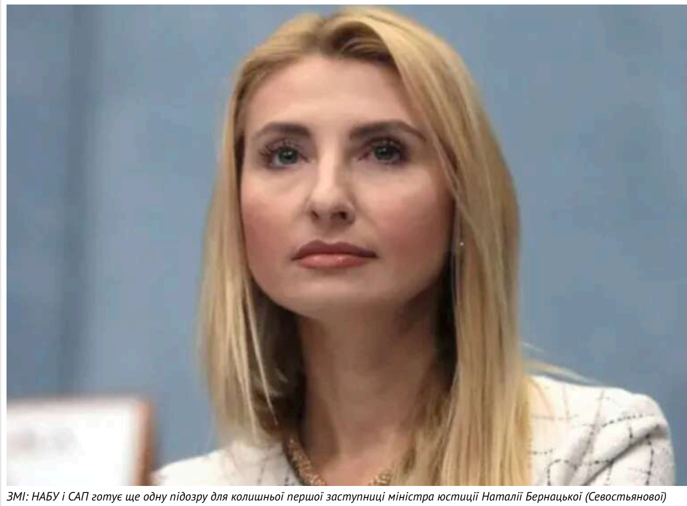
ЗМІ: НАБУ і САП готує ще одну підозру для колишньої першої заступниці міністра юстиції Наталії Бернацької (Севостьянової)

Вищий антикорупційний суд відмовив у проведенні заочного розслідування стосовно колишнього народного депутата Георгія Логвинського, якого НАБУ і САП підозрюють в організації заволодіння понад 54 млн грн державних коштів.