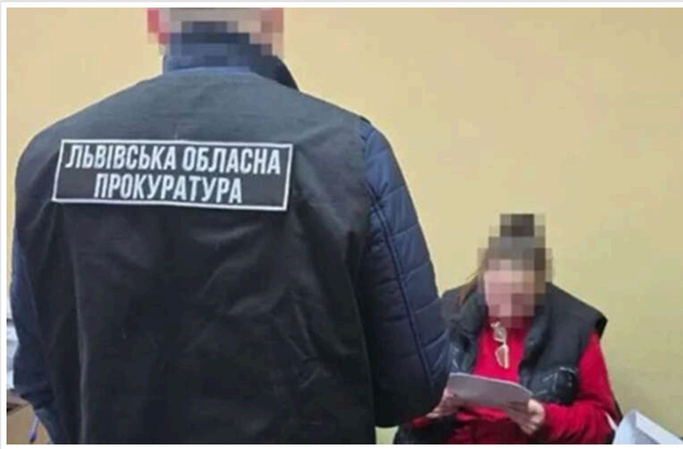
У Львові затримано двох диверсантів: поліція проводить перевірки по всьому місту

Агенти РФ мали намір закласти вибуховий пристрій в адміністративну будівлю одного з районних відділів поліції міста.