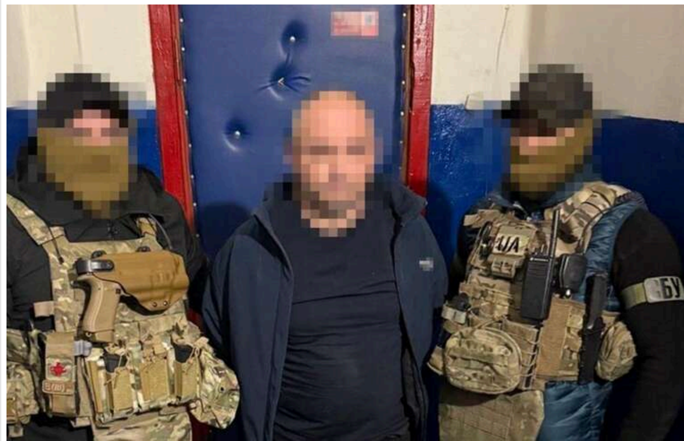
Теракт у відділенні поліції в Одеській області: затримали чоловіка, який вибухівку замаскував під подарунок

Зловмисник організував майстерню для створення вибухових пристроїв, один з яких мав форму вогнегасника.