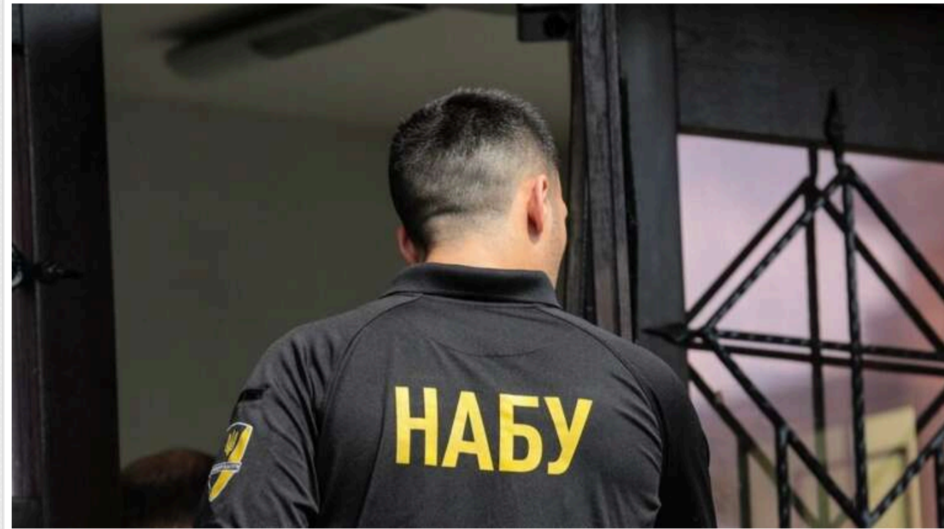
Скандал із «прослуховуванням»: НАБУ викрило адвокатів, які зливали закриті судові рішення

Зранку 1 квітня мережею почала поширюватися інформація, що НАБУ прослуховувало офіс київських адвокатів.