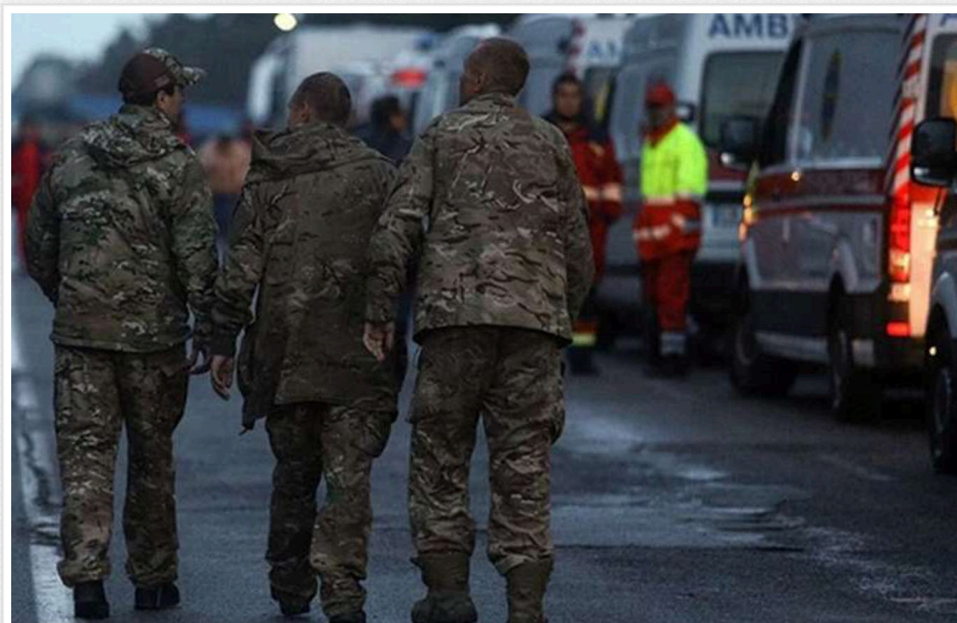
У ЗМІ розповіли, як не стати жертвою мародерів, які наживаються на родичах військових

За неофіційними даними (офіційні дані відсутні), в країні-агресорці на початок 2024 року в полоні було 8000 українських солдатів, на літо 2024 року – 6498 солдатів. У питаннях знаходження українських військовослужбовців у ворожому полоні багато незрозумілого. Щось обумовлено обставинами воєнного часу, політикою, щось людським чинником, а щось банальною бюрократією та чиновницькою тяганиною. Такий стан справ більш ніж влаштовує усіляких шахраїв, що наживаються на горі родичів, пише харківське видання “ДУМКА” .