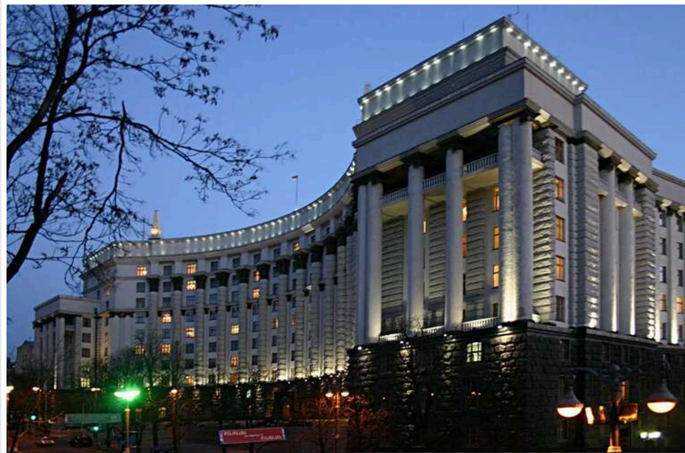
Мінрозвитку: Кабмін розширив квоту бронювання для працівників критичної комунальної інфраструктури до 75%

Порядок бронювання військовозобов'язаних від мобілізації знову змінено. Зміни стосуються як окремих галузей, так і загалом процедури бронювання.