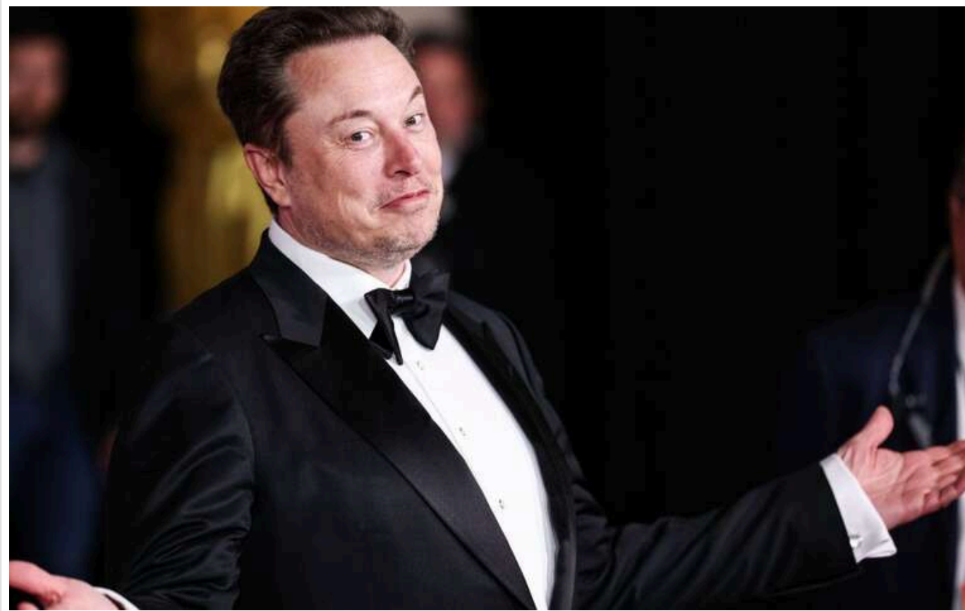
Маск попередив Трампа про можливий імпічмент: його кандидат програв на виборах у Верховний суд

На кону було місце у Верховному суді штату, за яке змагалися підтримувана демократами суддя округу Дейн Сьюзан Кроуфорд та колишній генеральний прокурор Вісконсина Бред Шімел.