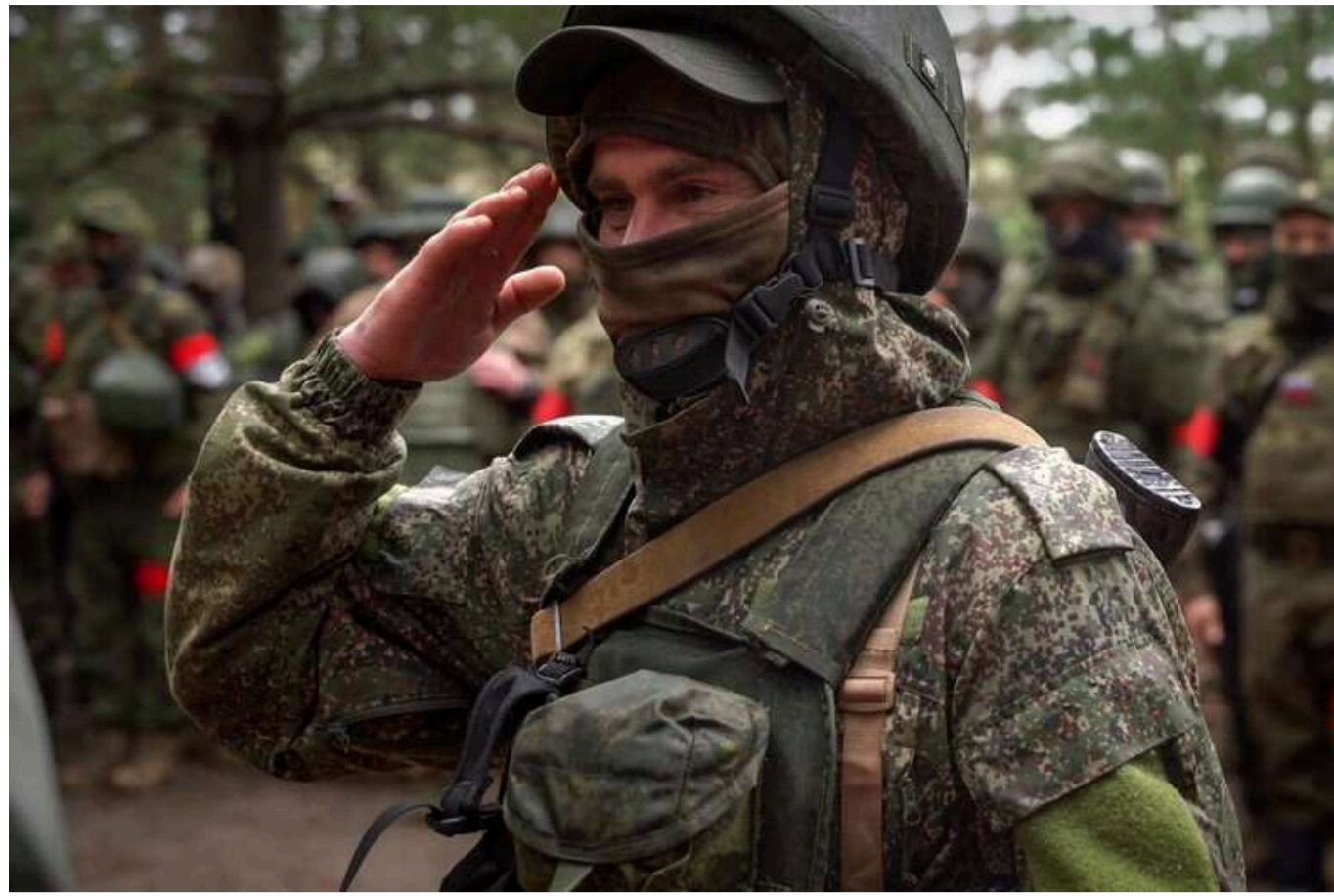
ЗС РФ готують наступ у квітні, - командир ЗСУ