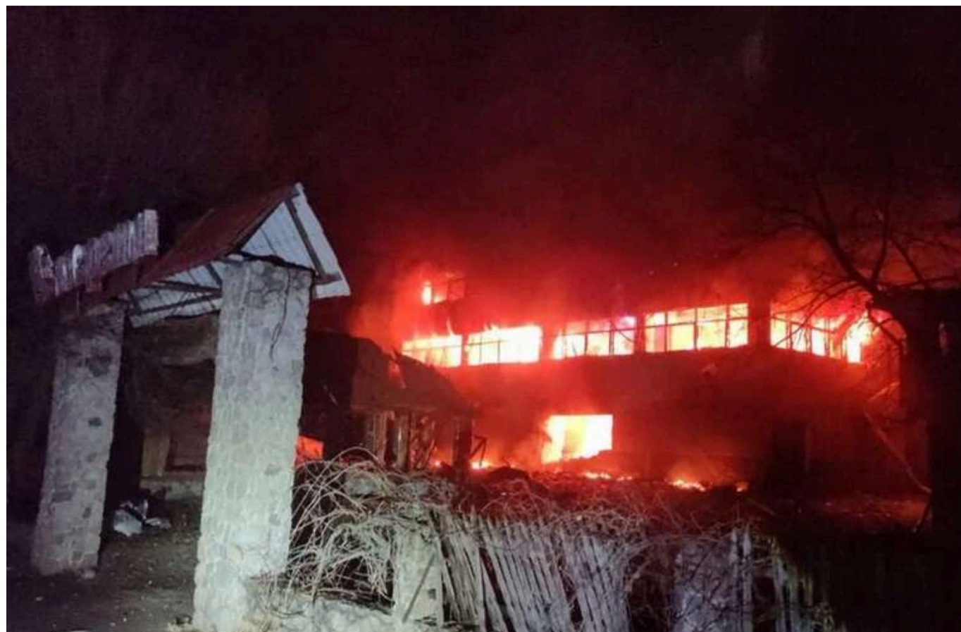
Росія масовано атакувала Харків "шахедами": в мережі показали відео, зняте одразу після прильоту

У ніч на 2 квітня в Харкові пролунали вибухи внаслідок російської атаки "шахедами". У Холодногірському районі міста спалахнули пожежі: під ударом опинилися два підприємства. Повідомляється про постраждалих мирних жителів, включаючи дітей.