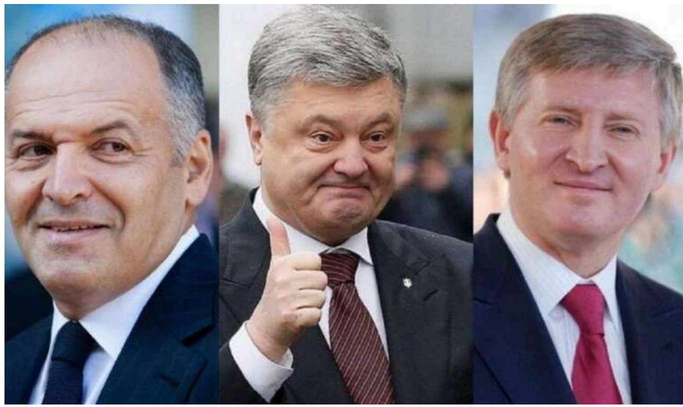
Статки Ахметова, Пінчука та Порошенка перевищили довоєнний рівень, - Forbes

Журнал Forbes публікує дивовижні дані про статки українських мільярдерів.