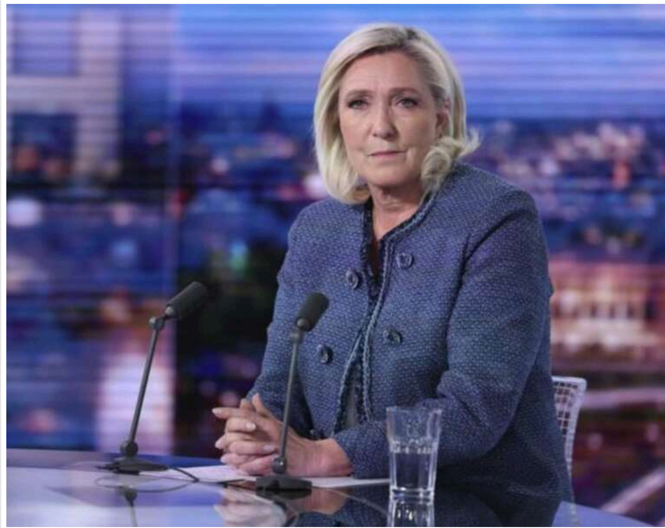
Марін Ле Пен має намір боротися за участь у виборах президента Франції 2027 року, попри судове рішення

Марін Ле Пен заявила, що вона не здається і буде боротися за своє право брати участь у виборах президента Франції у 2027 році, попри нещодавно прийняте судове рішення.