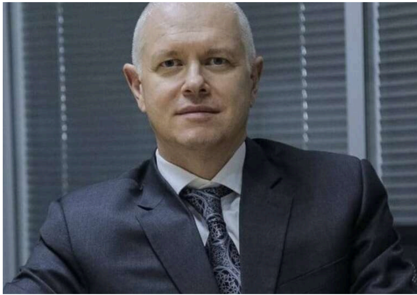
У новій справі щодо терміналу «Боріваж» есксерівнику «ПриватБанку» Яценку готується оголошення про підозру

Кілька тижнів тому, 13 березня зерновий термінал «Боріваж», за рішення суду, було передано в управління АРМА. Передувала цій події спроба Коломойського та Боголобова врятувати актив через одну з компаній Tiginka. Та довести злочинну "схему" до логічного завершення олігархам завадили детективи БЕБ. Тепер же, у новій кримінальній справі по "Боріважу", очікуються нові підозри та арешти, які стосуватимуться, зокрема, її представників колишнього топменеджменту "ПриватБанку".