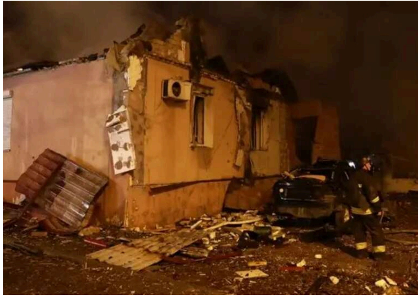
Кількість жертв російського удару 28 березня по Дніпру зростає до п'яти

Кількість загиблих в результаті російської атаки на Дніпро збільшилась, про це повідомив керівник обласної військової адміністрації Сергій Лисак. У лікарні помер один із постраждалих місцевих мешканців.