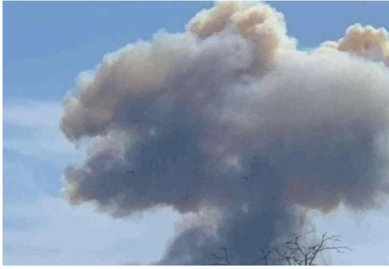
Росія порушує енергетичне перемир'я, нова атака завдала шкоди об'єкту в Херсоні, - МЗС

Міністр закордонних справ України Андрій Сибіга заявив, що через російський обстріл енергетичної інфраструктури в Херсоні вранці без світла залишилися 45 тисяч жителів.