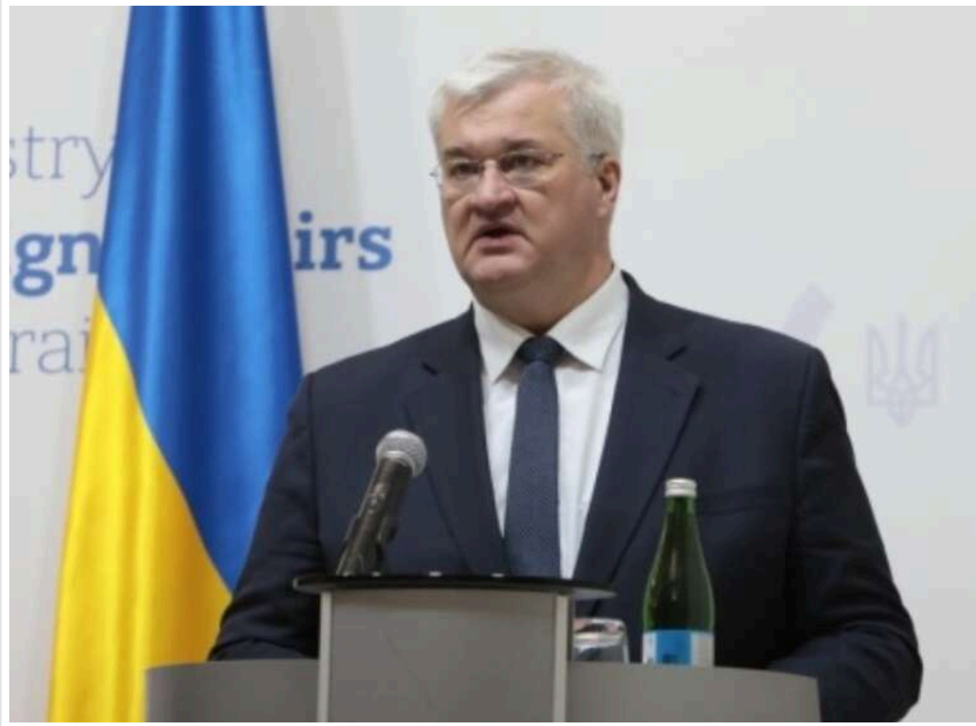
Україна та США працюватимуть над досягненням взаємоприйнятної угоди про надра, - Сибіга

Київ працює над тим, щоб угода щодо корисних копалин взаємно враховувала національні інтереси Сполучених Штатів та України.