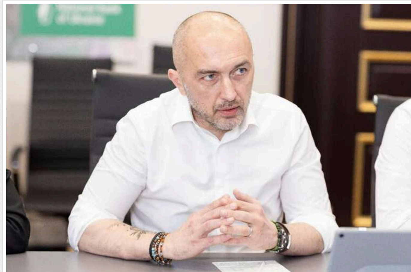
Голова НБУ показав свою декларацію: Родина Пишного, який відповідає за стабільність гривні, надає перевагу інвестиціям у долари

Пишний часто акцентує увагу на привабливості інвестицій у гривні, але його родина купує багато доларових цінних паперів.