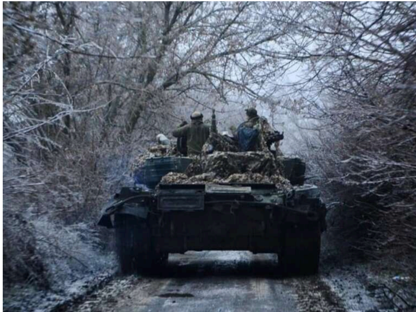
Втрати ворога: ЗСУ відмінували ще 1540 окупантів та 9 танків ворога

За минулу добу, 31 березня, окупанти втратили у війні проти України ще 1540 одиниць живої сили. Також українські захисники знищили десятки одиниць ворожої техніки.