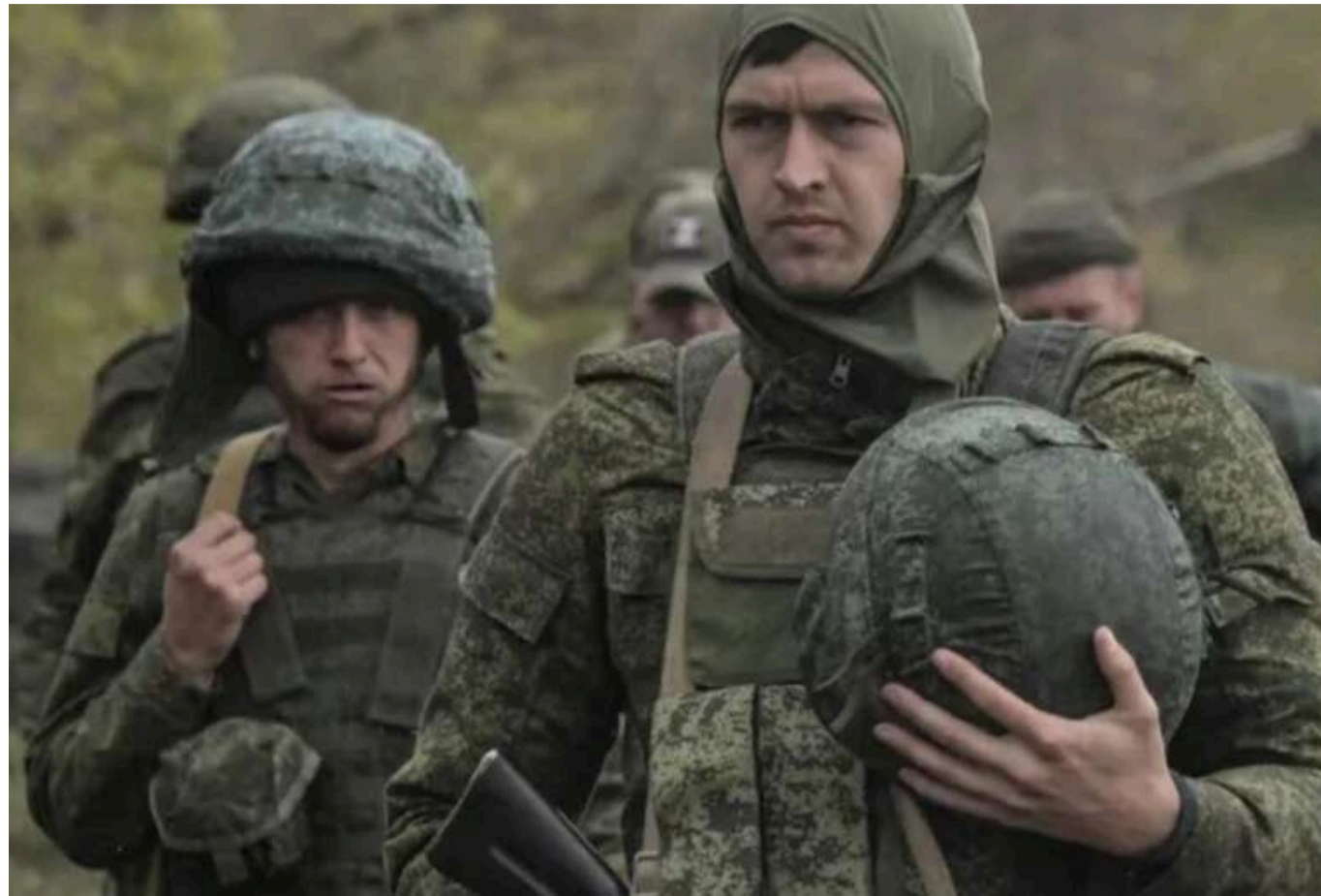
Росія розпочала весняний призов, примусово мобілізуючи жителів окупованих територій України

З 1 квітня в Росії, а також на окупованих нею територіях України – в Донецькій, Луганській, Запорізькій та Херсонській областях – починається весняний призов до армії країни-агресорки. Уже активно триває розсилка повісток, причому не лише за місцем проживання.