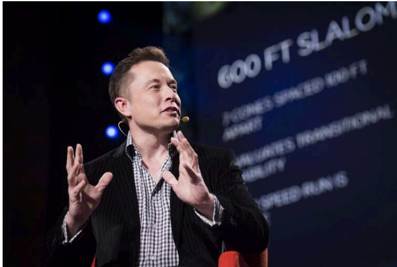
Ілон Маск заявив про плани скоротити федеральний бюджет США на 1 трильйон доларів

Генеральний директор Tesla щойно оголосив, що планує скоротити витрати федерального бюджету США на трильйон доларів. Однак невідомо, що він робитиме, коли завершиться його термін на посаді "спеціального державного службовця".