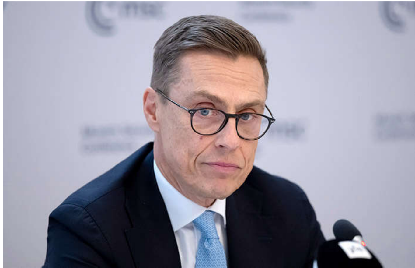
Трамп – єдина людина, яка може стати посередником між Україною та Росією, - Стубб

Єдиною особою, яка, ймовірно, може стати посередником між Україною та країною-агресоркою Росією, є президент США Дональд Трамп.