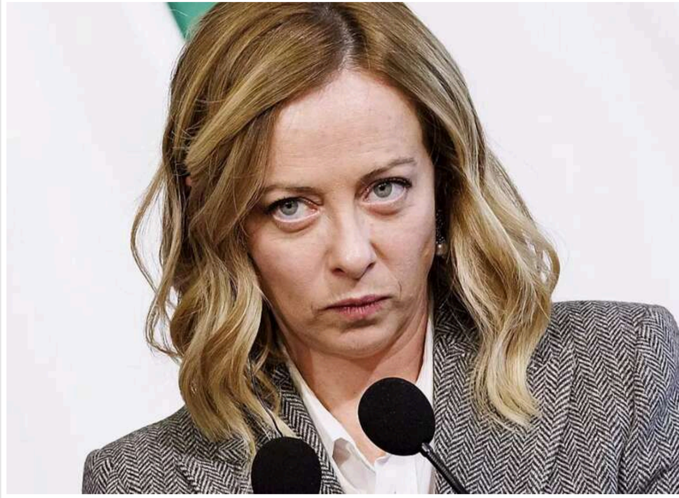
План Мелоні щодо статті 5 НАТО для України виявить справжні наміри Путіна, – Bloomberg

План Мелоні заслуговує на те, щоб його спробувати, вважає експерт.