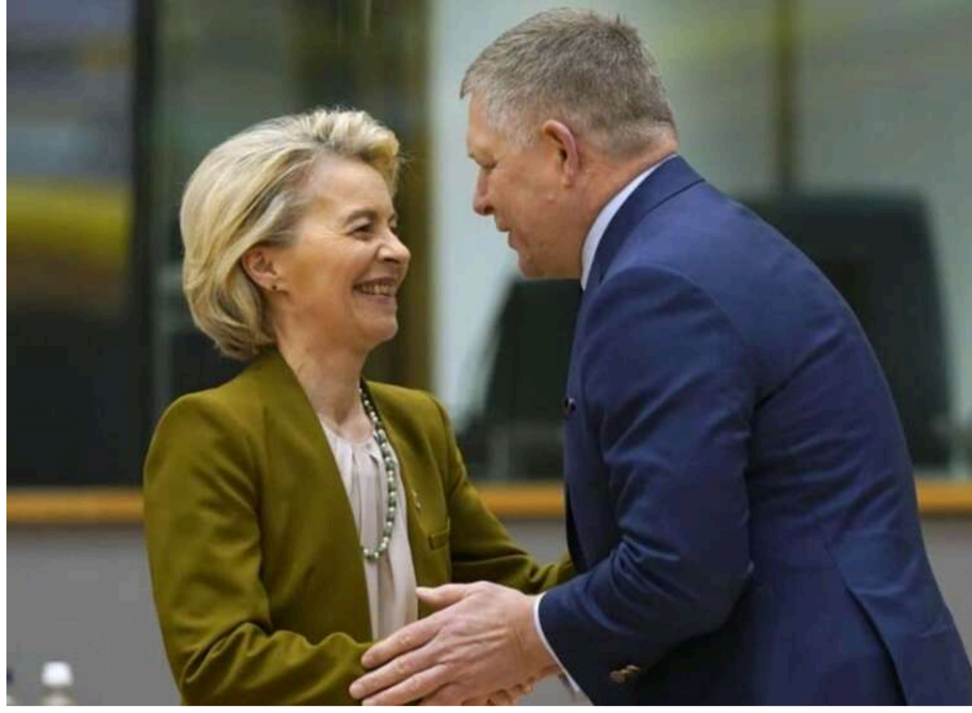
Фіцо спростував, що глава Єврокомісії назвала його «повним ідіотом»

Прем'єр-міністр Словаччини Роберт Фіцо заперечив, що президентка Єврокомісії Урсула фон дер Ляєн назвала його «повним ідіотом».