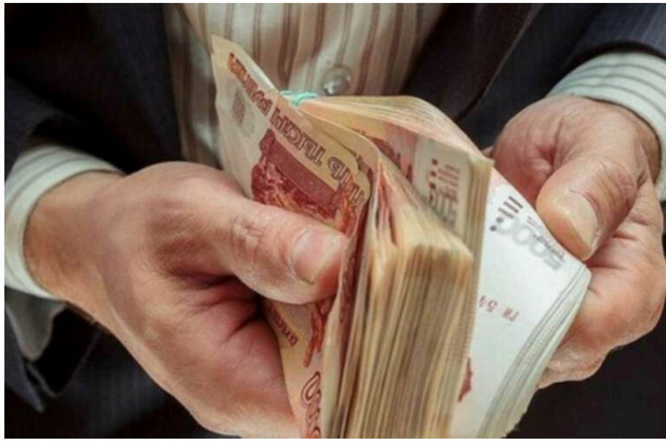
У Росії різко зросла заборгованість із виплати зарплат, – ЦПД

У Росії спостерігається різке зростання заборгованості із заробітних плат, протягом року кількість таких звернень зросла на третину.