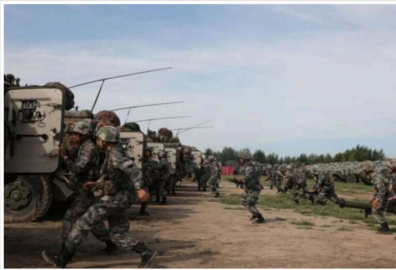
Китай розпочав військові маневри навколо Тайваню

Китай повідомив про проведення великих спільних навчань своїх ракетних, сухопутних та військово-морських сил біля Тайваню.