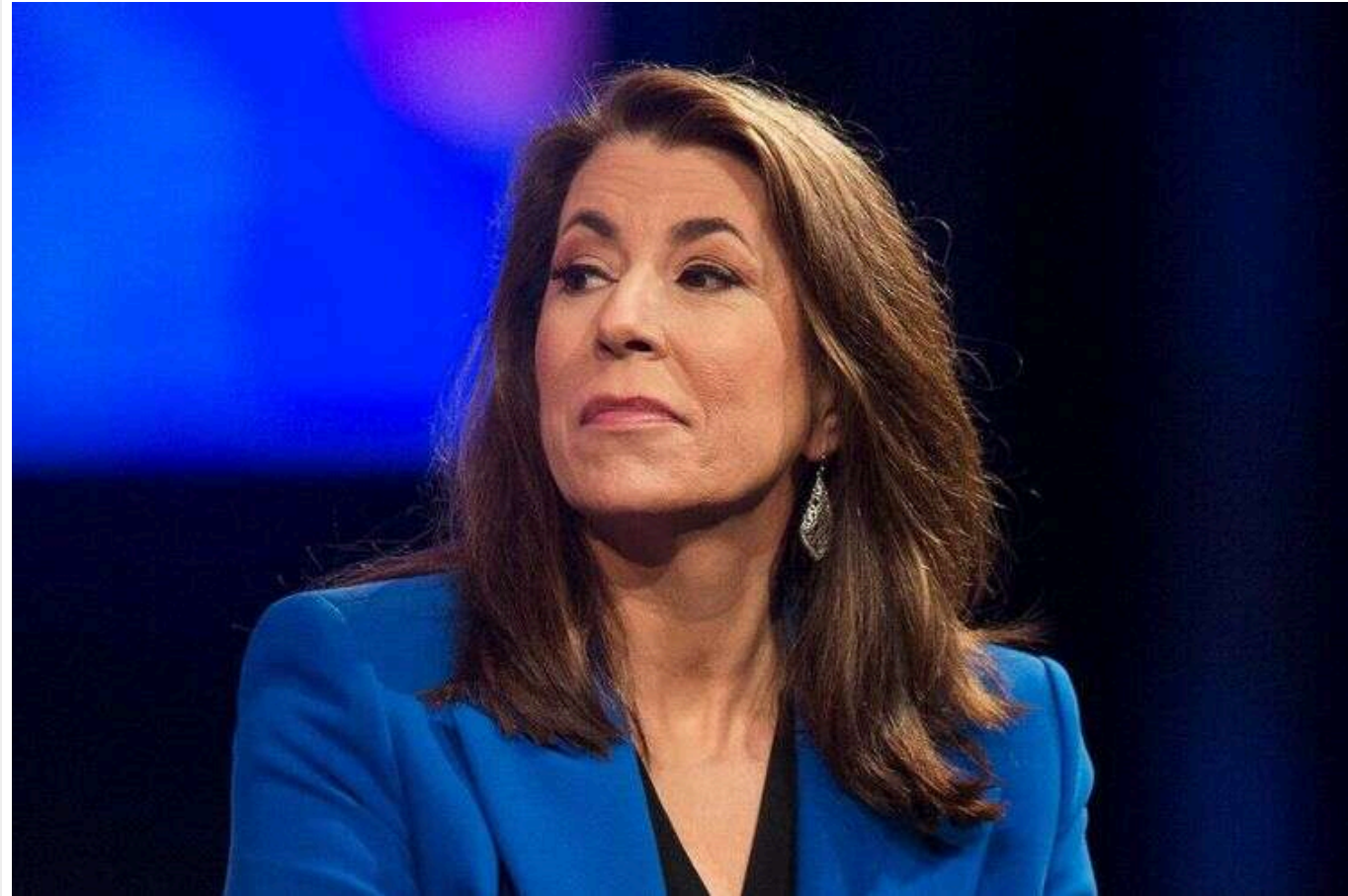
США стурбовані усуненням політиків із процесу, - Теммі Брюс про вирок Марін Ле Пен

Керівниця пресслужби Державного департаменту США Теммі Брюс прокоментувала вирок голові парламентської фракції французької партії "Національне об'єднання" Марін Ле Пен, який, зокрема, забороняє їй брати участь у виборах.