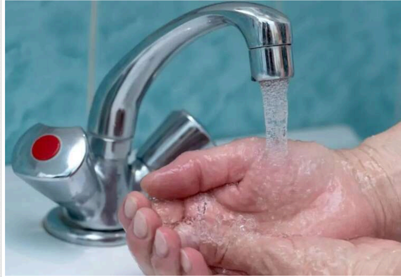
В Україні можуть запровадити графіки подачі води через значні борги населення, - Кицак

Народний депутат України Богдан Кицак, член Комітету Верховної Ради з питань економічного розвитку, 31 березня заявив, що у багатьох містах України можуть бути запроваджені графіки подачі води через значні борги населення за комунальні послуги.