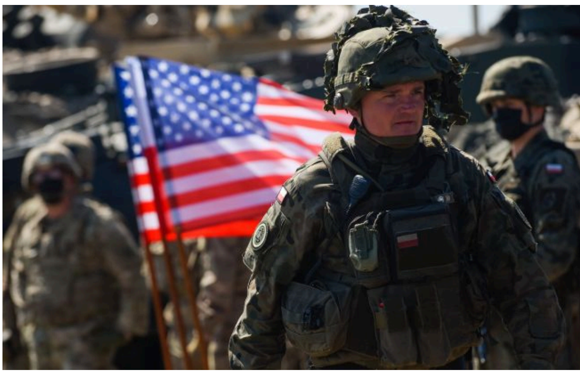
Фото: виведення військ із Німеччини може коштувати млрд доларів