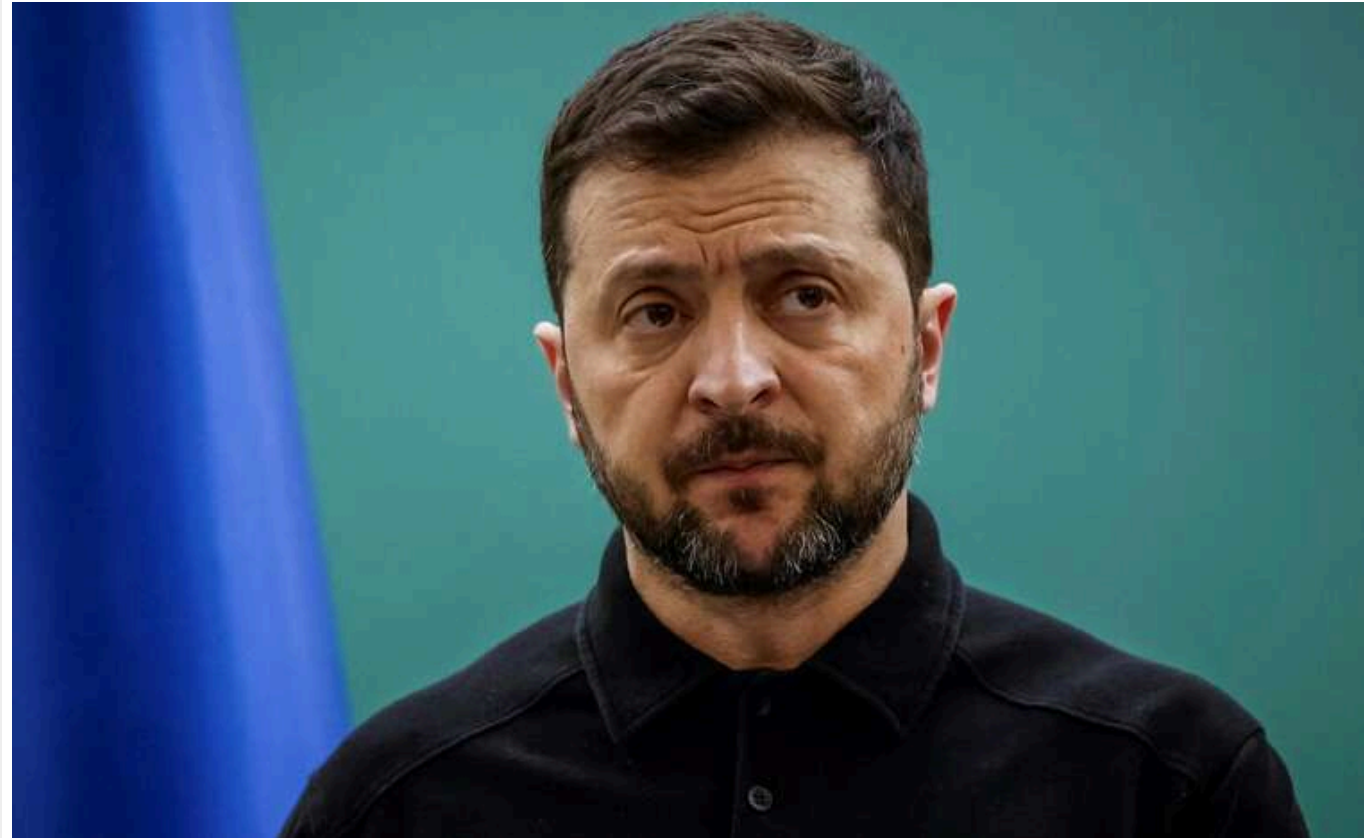
Кремль націлений на усунення Зеленського та зміну влади в Україні, – росЗМІ

Кремль націлений на відсторонення президента України Володимира Зеленського, сподіваючись замінити його більш поступливим керівництвом, повідомляють джерела The Moscow Times, близькі до російських дипломатів.