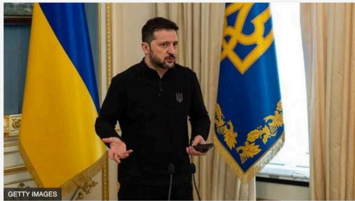
В Офісі президента кажуть, що наради щодо виборів не було