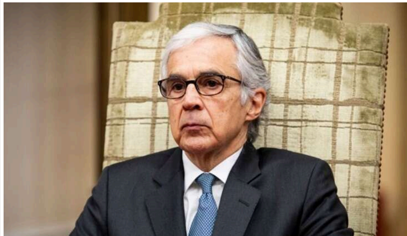
До України прибув спікер парламенту Португалії

Президент Асамблеї Португалії Жозе Педро Агіар-Бранку прибув із візитом до України в понеділок, 31 березня. Він запланував зустріч з президентом Володимиром Зеленським.