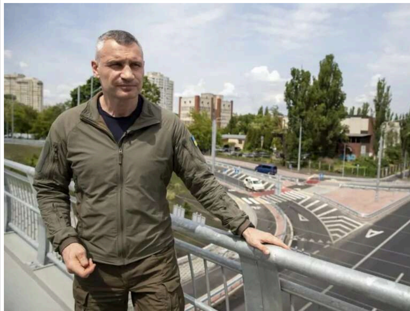
Метро по 64 гривні, а автобус — по 44: у КМДА пояснили неминучість подорожчання проїзду мільярдними збитками

Електронна петиція з вимогою зупинити підвищення тарифів на проїзд у комунальному транспорті столиці до завершення воєнного стану не отримала підтримки міської влади.