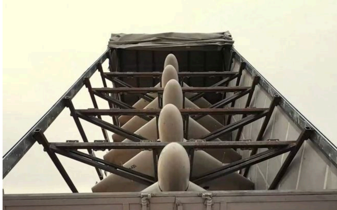
Фото: дрони "Шахед"